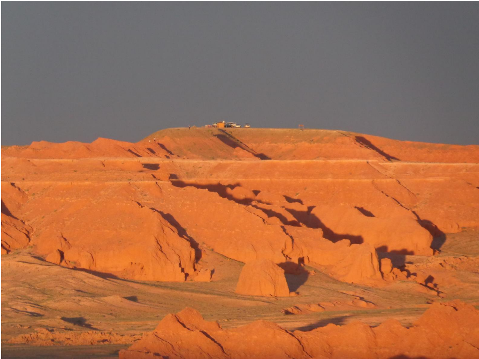
ACANTILADOS DEL FUEGO DE BAYANZAG EN EL DESIERTO GOBI