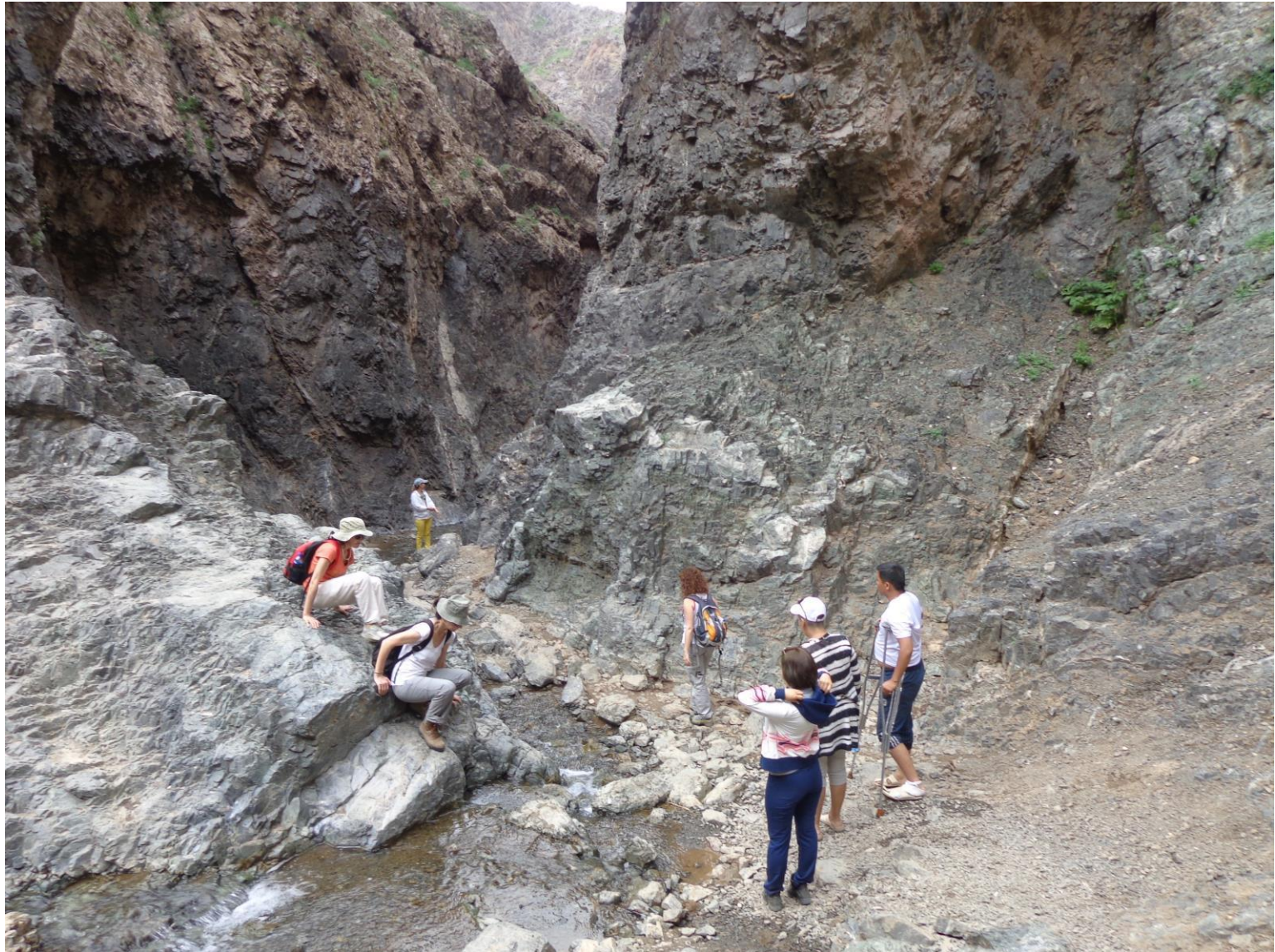
CAÑÓN DE YOLYN O GARGANTA DEL QUEBRANTAHUESOS EN EL DESIERTO GOBI